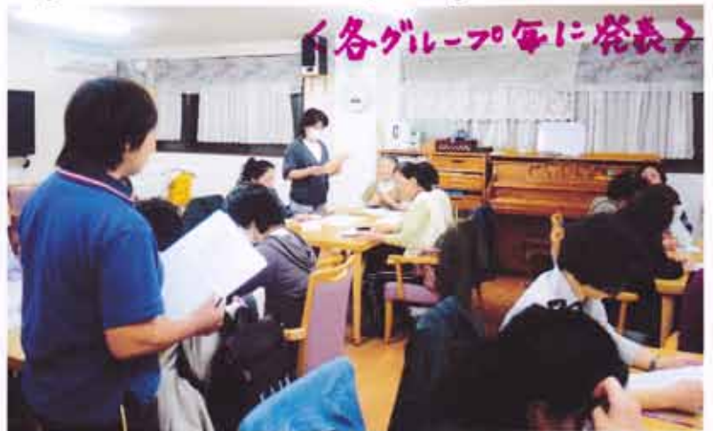
<各グループ毎に登表>